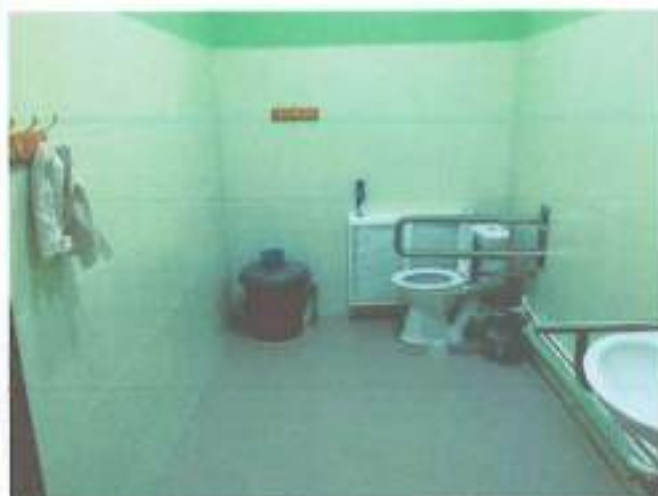
фото 68 (санитарно-гигиеническое помещение для инвалидов)