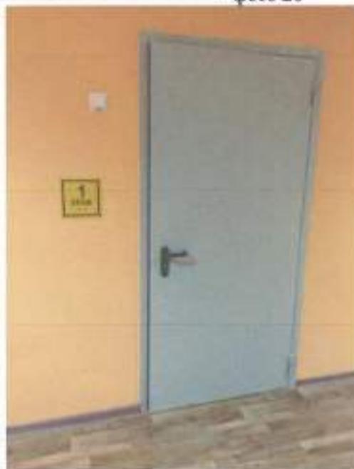
фото 30 (лифт)